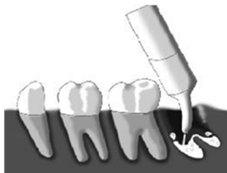
Gebruik van het spuitje

sputje heeft meegekregen, is het gebruik als volgt: 2 dagen na de ingreep ( na 48 uur) kunt u beginnen het wondje schoon te spoelen met de mondspoel drank, na de maaltijd. U doet eerst wat mondspoel drank in een glas, zuigt dit op met het spuitje en zet de tip van de spuit zo diep mogelijk in de lege tandkas. (dat is holletje waar de kies gezeten heeft, zie plaatje). De tandkas met enige druk uitspoelen.