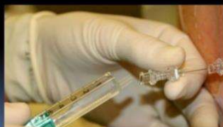
Afbeelding 1: Intrathecaal fenol ( lower end block ).