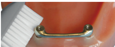
Afb. 2. Poetsen met een zachte tandenborstel.

Implantaten die de functie van 'pijlers' hebben onder een (overkappings)prothese maakt u schoon met een zachte tandenborstel, ragers en/of met (super)flossdraad. Poets twee keer per dag het deel van het implantaat dat boven het tandvlees uitsteekt. Besteed extra aandacht aan de overgang van het implantaat naar het tandvlees. Maak de ruimte onder de spalk schoon met ragers en/of (super)flossdraad.