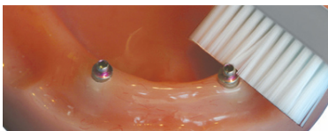
Afb. 4. Poetsen implantaat dopjes.

Naast het goed schoonhouden van de implantaten, is het ook belangrijk dat u de prothese twee keer per dag goed schoonpoetst.