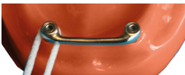
Afb. 3. Gebruik van flossdraad.