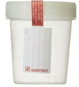
Figuur 1: steriel semen potje

U dient een afspraak te maken met het laboratorium voor het inleveren van het monster. U belt hiervoor de administratie van het laboratorium op telefoonnummer 0182-505342. Heeft u geen potje ontvangen, dan kunt u een potje ophalen bij de administratie van het laboratorium (route 54) in het GHZ of bij uw eigen huisarts. Dit kan op werkdagen tijdens kantooruren.