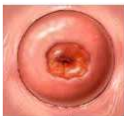
Figuur 2. Baarmoedermond met ectropion