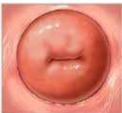
Figuur 1. Baarmoedermond zonder ectropion