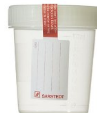
Figuur 1: steriel semen potje

Heeft u geen potje ontvangen, dan kunt u een potje ophalen bij de poli bloedafname (route 27) in het GHZ. Dit kan op werkdagen tijdens kantooruren.