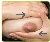
Hände flach auf die Brust legen. Mit sanften Hin- und Herbewegungen massieren, ohne die Haut zu verschieben