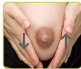
Hände seitlich positionieren