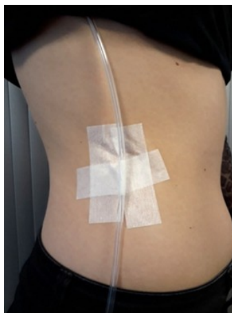
Figuur 1: Redondrain 'getunneld' op het lichaam.

Om de insteekopening van de redondrain te beschermen, wordt de insteekopening afgedekt met een Tegaderm (verband/pleister). Door onverwachtse bewegingen kan er druk komen op de insteekopening. Om dit te voorkomen kan de redondrain 'getunneld' worden aan uw lichaam, door middel van huidvriendelijke tape (figuur 1). De verpleegkundige laat tijdens de opname aan u zien hoe dit moet.